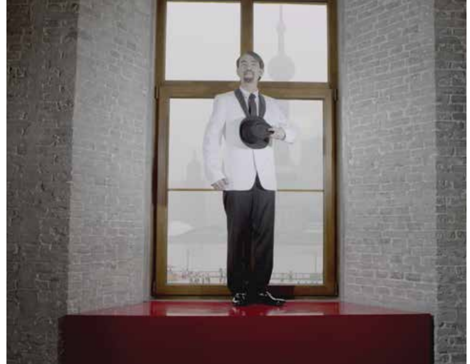
Acting Out Artist , 2012 14'56", ses, tek kanallı video 14'56", sound, single-channel video