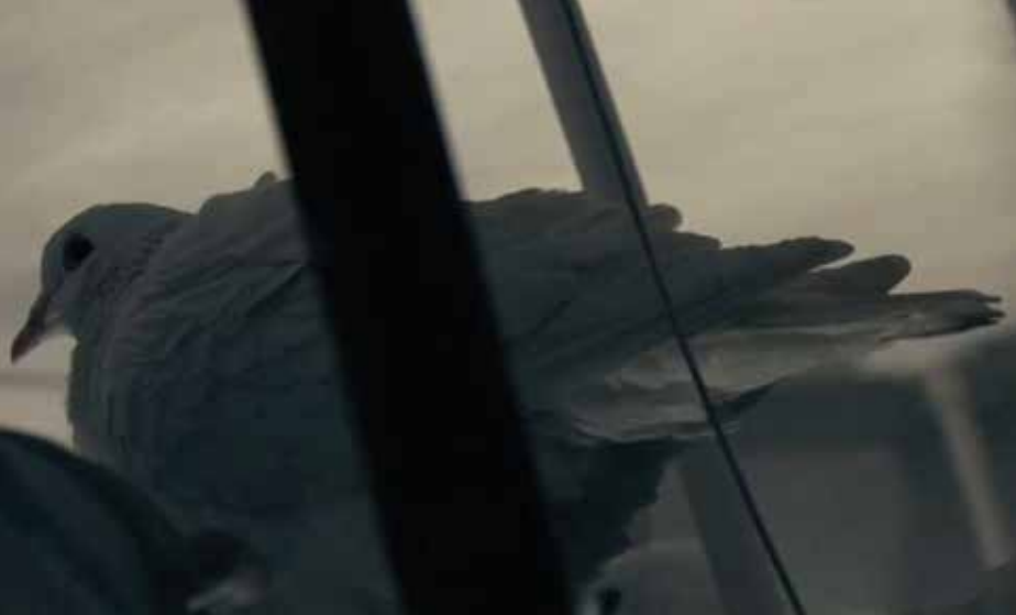
Rock Dove , 2009 5', ses, tek kanallı video 5', sound, single-channel video