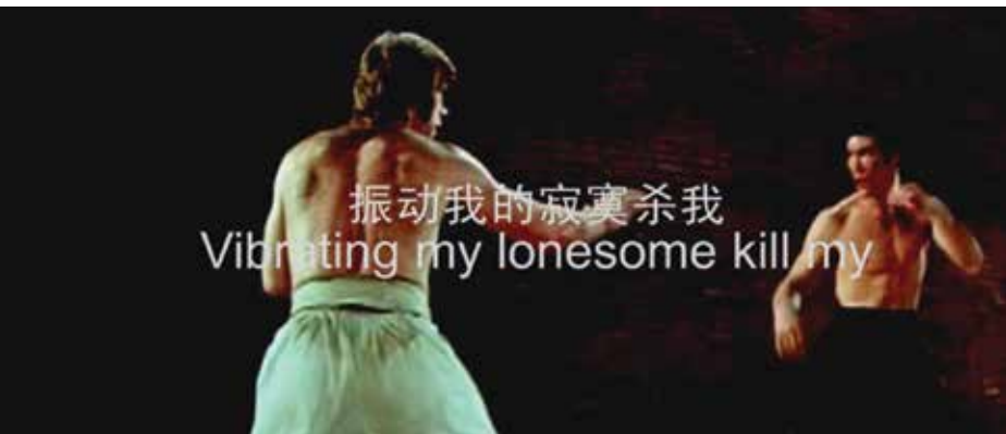
Hit Me Baby One More Time , 2010 3'35", tek kanallı video 3'35", single-channel video