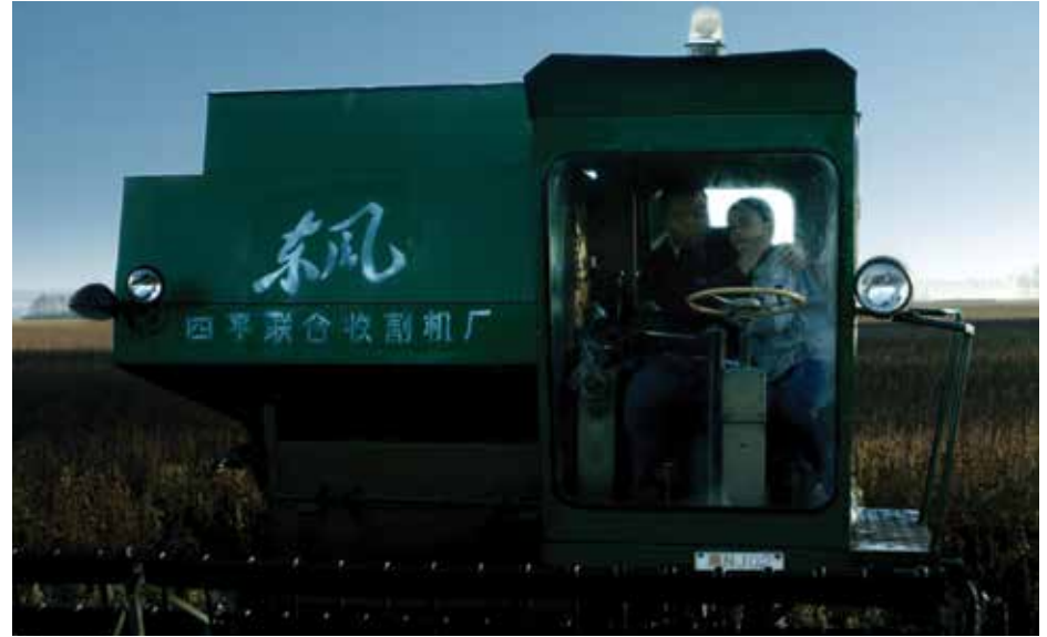
Combine Harvester , 2013 6', ses, tek kanallı video 6', sound, single-channel video