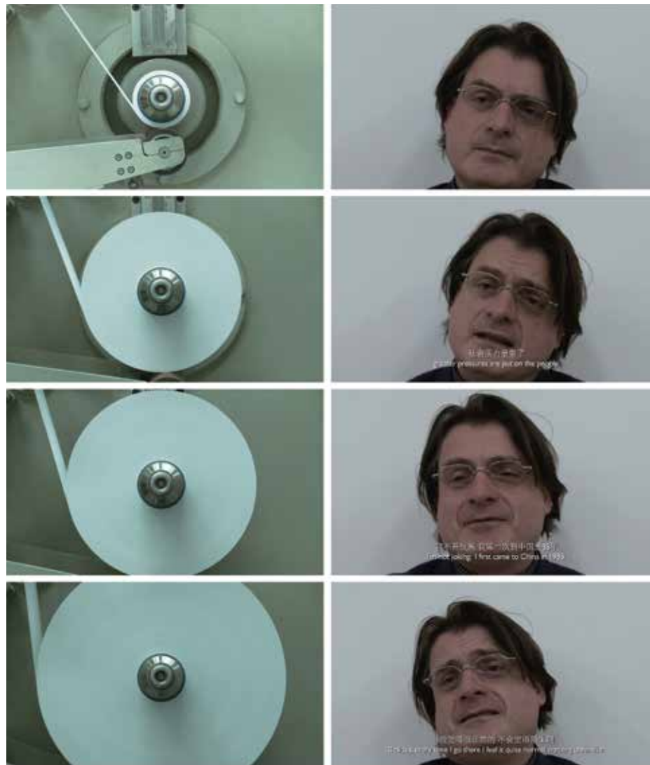
A Foreign Boss , 2010 6'50", ses, tek kanallı video 6'50", sound, single-channel video