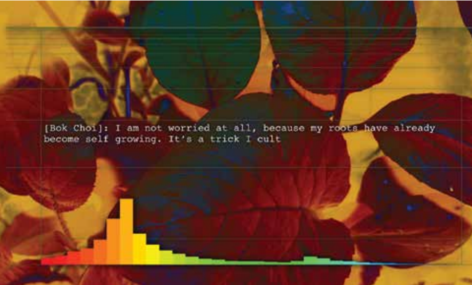
Invasive Species - the vegetables , 2015 5', tek kanallı video 5', single-channel video