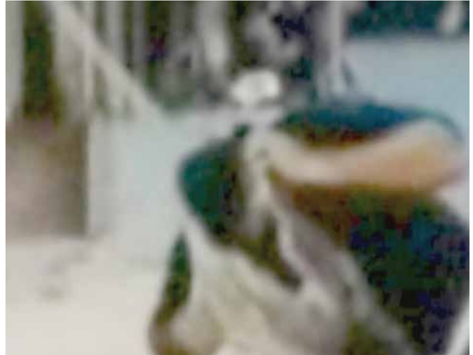
Untitled , 2013 2'35", tek kanallı video 2'35", single-channel video