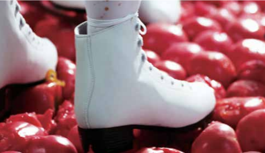
Rainbow , 2013 10', tek kanallı video 10', single-channel video