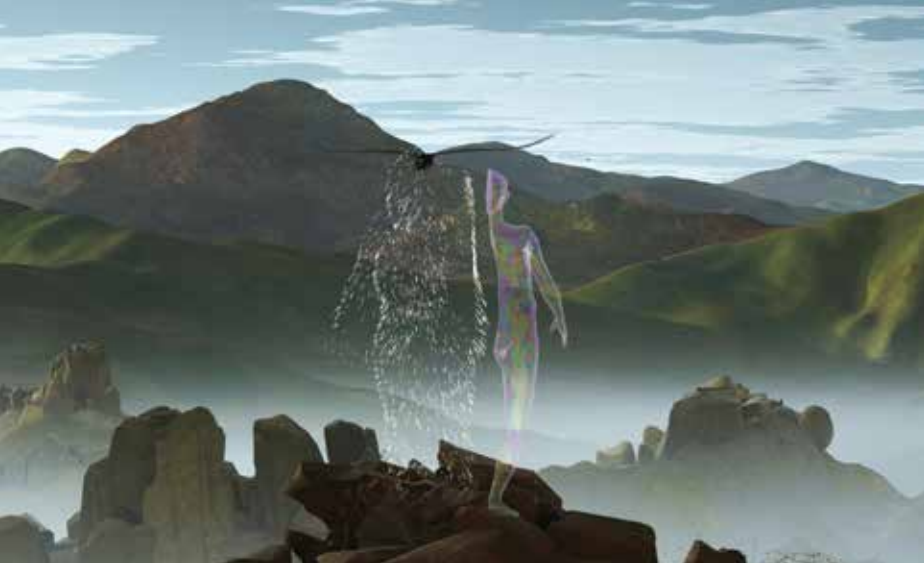
Disillusion , 2010-12 10', 3 boyutlu bilgisayar animasyonu, tek kanallı video 10', 3D computer animation, single-channel video