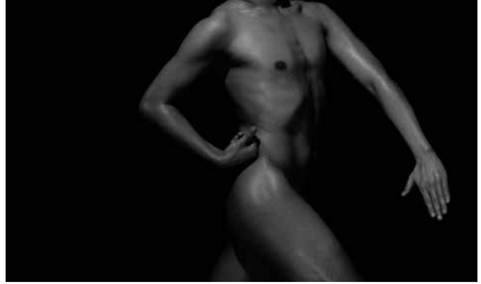
The History of Fuge , 2012 5'33", tek kanallı video 5'33", single-channel video